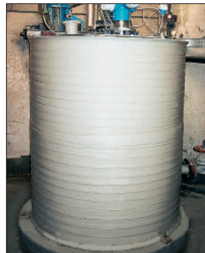
PP-Rührwerksbehälter mit Konusboden zum Anmischen von Salzsäure