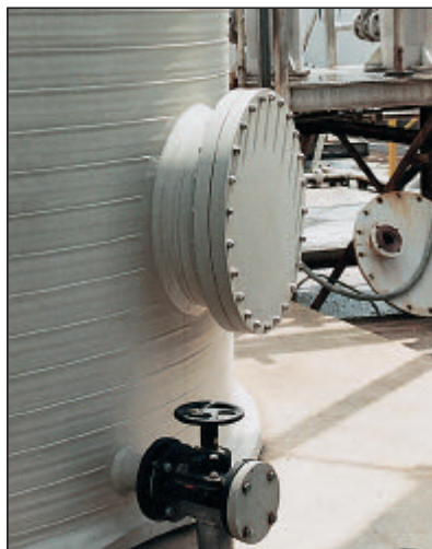
Mannloch DN 600 im Zylinder