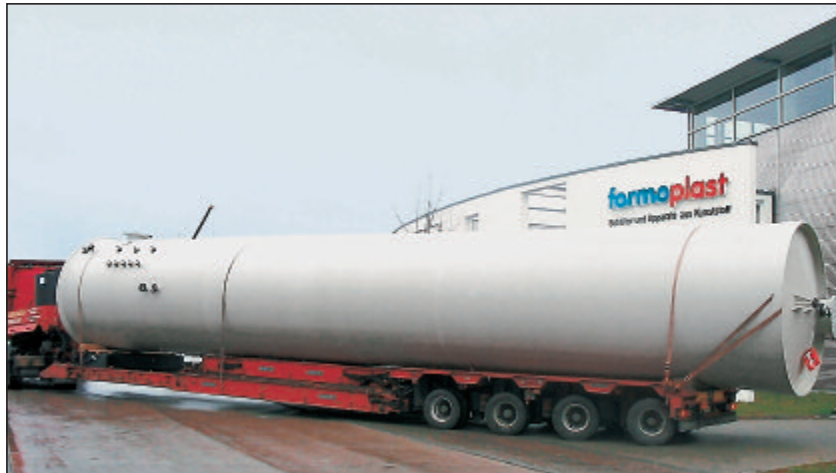
PP-Lagerbehälter mit Flachboden für Biodiesel